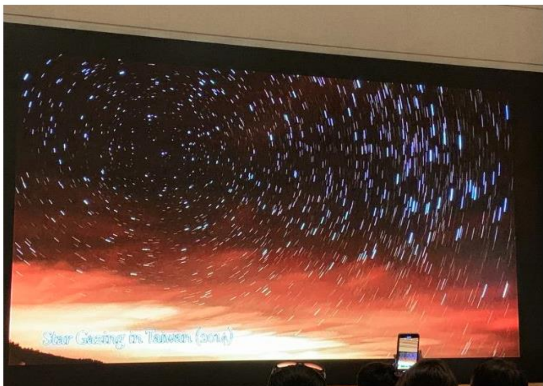
^同學有機會參加天文遊學團，上天文攝影課。照片由學生親自操刀。