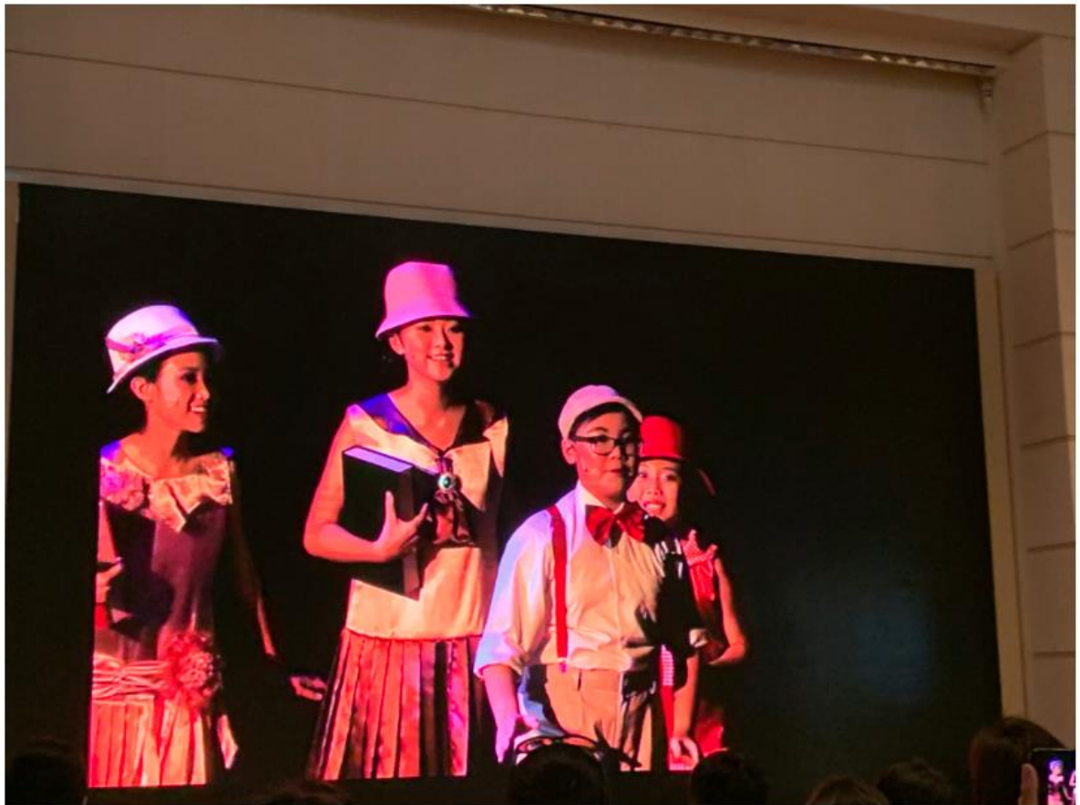
^學校戲劇結合了音樂、舞蹈和戲劇3大元素。